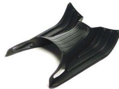
Gummi Fussmatte 602734M

Speziell entwickelt für Touring-Fahrten zu zweit, mit progressivem, zweifachen Federungssystem. Erleichtert die Handhabung des Fahrzeugs und verbessert die Leistung der Dämpfung. Die Voreinstellung ist durch die Ringvorspannung einfach regulierbar, da der Federhalter weit vorne positioniert ist.