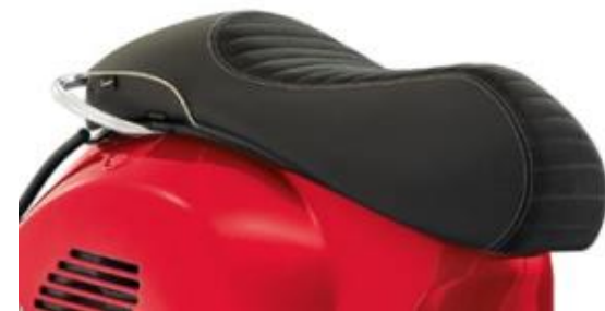
Sport Einzelsitzbank 1B001823

Doppelsitzbank im sportlichen Look. Mit wasserabweisender Oberflächenbehandlung. Doppelnäht im Fahrerbereich. Fähnchen mit Vespa Logo hinten links.