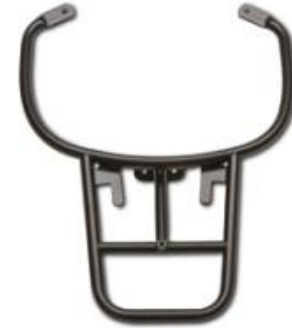
Gepäckträger Schwarz 1B001909

Die verchromte Halterung ist ein funktionales und stylisches Zubehör, das die Formen des Fahrzeugs harmonisch ergänzt. Die hochwertige Verchromung bietet langjährige Haltbarkeit.