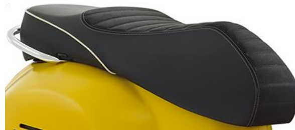
Sport Doppelsitzbank 606695M

Elegante Zubehör-Sitzbank aus hochwertigem Leder. Made in Italy. Die spezielle Behandlung des Leders sorgt für seine Langlebigkeit.