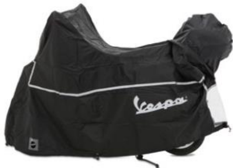
Outdoor Fahrzeug-Abdeckplane 605291M001

Outdoor Abdeckplane aus hochwertigen Materialien. Mit Stauplatz für Zubehör.