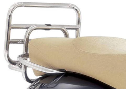
Klappgepäckträger Hinten Chrom 606525M Schwarz 1B000681

Ein stylisches und gleichzeitig funktionales Zubehör, das zusammen mit dem hinteren Gepäckträger die Vespa noch einzigartiger macht.