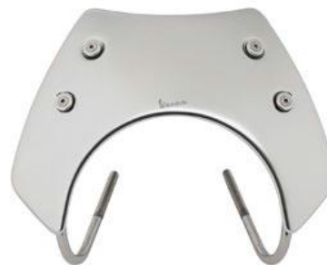
Aluminium Sport Flyscreen 1B004736

Premium Zubehör-Kit aus hochwertigem Material. Die Entfernung der Hebel zu den Handgriffen ist verstellbar und erlaubt zusammen mit den Lenkerenden eine perfekte Ausbalancierung des Gewichts. Mit gelasertem Vespa Logo auf allen Komponenten.