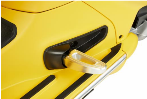
Sozius Fussrasten 1B004742

Sozius-Fussrasten für eine bequeme Nutzung der Vespa, sowohl für den Fahrer als auch für den Beifahrer. Mit gelasertem Vespa Logo.