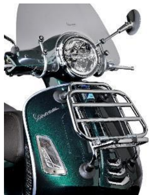
Klappgepäckträger Vorne Chrom 1B003754 Schwarz 1B007202

Ein stylisches und gleichzeitig funktionales Zubehör, das zusammen mit dem hinteren Gepäckträger die Vespa noch einzigartiger macht.