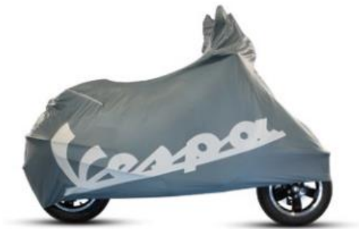
Indoor Fahrzeug-Abdeckplane 606334M

Outdoor Abdeckplane aus hochwertigen Materialien. Mit Stauplatz für Zubehör.