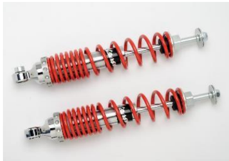
Stoßdämpfer komplett hinten (Paar) 601819M

Speziell entwickelt für Touring-Fahrten zu zweit, mit progressivem, zweifachen Federungssystem. Erleichtert die Handhabung des Fahrzeugs und verbessert die Leistung der Dämpfung. Die Voreinstellung ist durch die Ringvorspannung einfach regulierbar, da der Federhalter weit vorne positioniert ist.