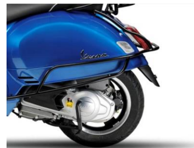
Sturzbügel Hinten Schwarz 1B000703 Chrom 602960M

Schmückt und schützt den Kotflügel mit seinem einfachen aber eleganten Design.