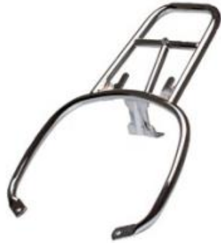
Gepäckträger Chrom 657081

Die verchromte Halterung ist ein funktionales und stylisches Zubehör, das die Formen des Fahrzeugs harmonisch ergänzt. Die hochwertige Verchromung bietet langjährige Haltbarkeit.