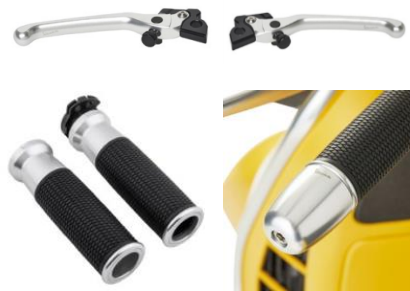
GTS Aluminium Sport Lenkerkit mit Hebeln, Griffen und Lenkerenden 1B005149

Premium Zubehör-Kit aus hochwertigem Material. Die Entfernung der Hebel zu den Handgriffen ist verstellbar und erlaubt zusammen mit den Lenkerenden eine perfekte Ausbalancierung des Gewichts. Mit gelasertem Vespa Logo auf allen Komponenten.