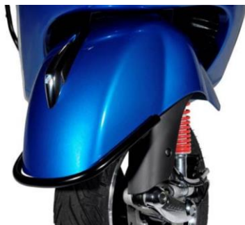
Stoßschutz Kotflügel Schwarz 1B000704 Chrom 602890M

Schmückt und schützt den Kotflügel mit seinem einfachen aber eleganten Design.