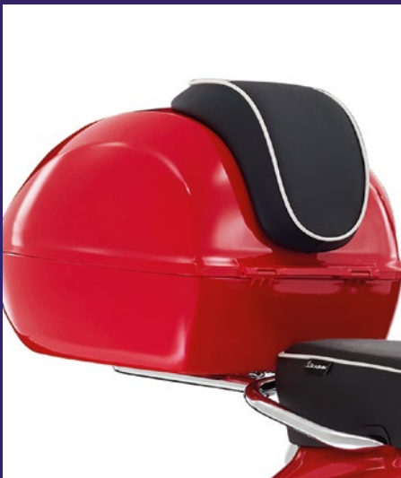
TOP CASE IN FAHRZEUGFARBE LACKIERT