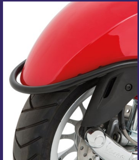
SCHUTZBÜGEL VORDERRADABDECKUNG IN SCHWARZ MATT