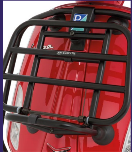
GEPÄCKTRÄGER VORNE IN SCHWARZ MATT